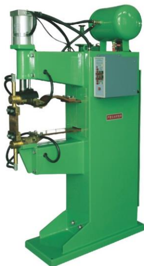
【 DNW1-40-B-500 】