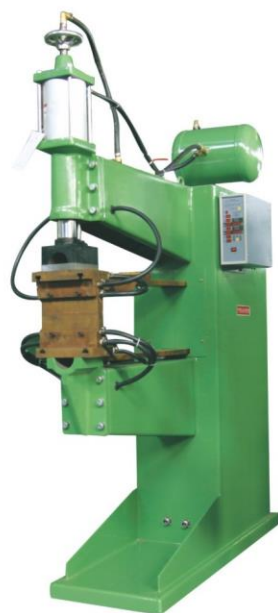
【 DNW1-150-A-800 】