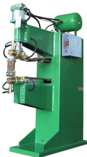
【 DNW1-80-B-650 】