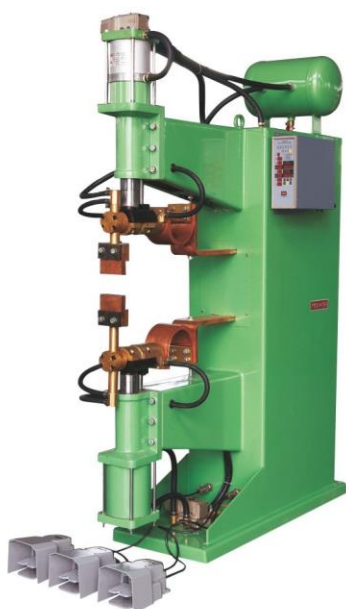
【 DNW2-150-B-800 】

排焊机系列: DNW 1 /DNW 2 -P-A/B-L DNW 1 /DNW 2 : 气动交流排焊机 ( 1: 上带气缸 2: 上下带气缸 ) P: 额定容量 A/B: A, 表示内外有电极; B, 表示只外有电极 L: 臂深尺寸, 即臂长尺寸 例如: (1) 额定容量为80KVA, 上带气缸, 内外 电极, 臂深尺寸为650mm的排焊机表 示为 DNW 1 -80-A-650 (2) 额定容量为100KVA, 上下带气缸, 外电极, 臂深尺寸为800mm的排焊机 表示为 DNW 2 -100-B-800